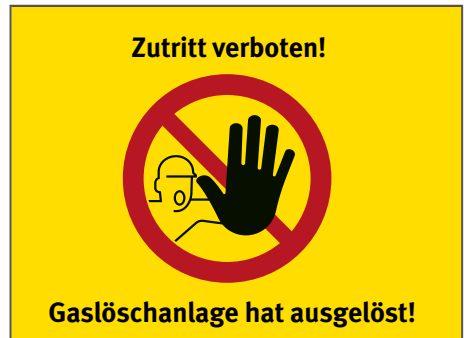
Abb 1 Beispiel eines Leuchtzeichens

An den Zugängen zu den Löschbereichen bzw. Gefährdungsbereichen müssen zusätzlich Warnleuchten oder Leuchtzeichen auf den ausgelösten Zustand der Löschanlage hinweisen, wenn der Zutritt nicht durch andere geeignete Maßnahmen verhindert wird.